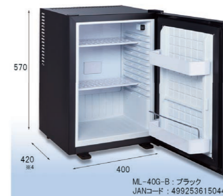
ML-40G-B : ブラック JANコード : 4992536150440