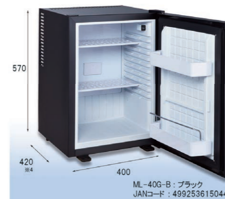
ML-40G-B: ブラック JANコード: 4992536150440