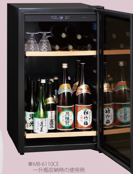
※MB-6110CE 一升瓶収納時の使用例