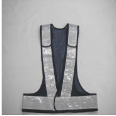
着丈 56cm、ウエスト 90cm