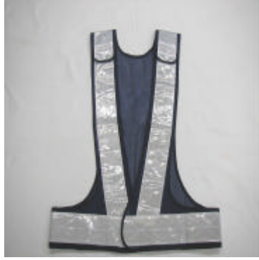
着丈 62cm、ウエスト 102cm