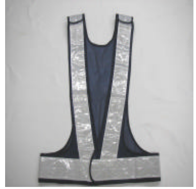
着丈 68cm、ウエスト 136cm